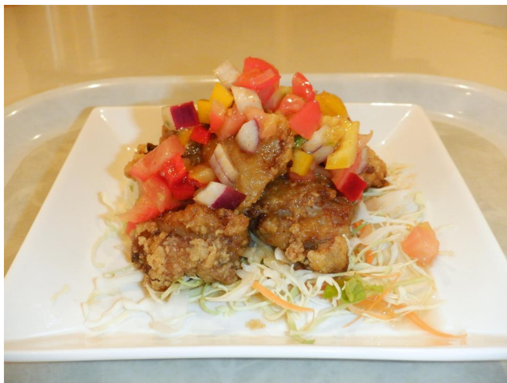
元気亭。で提供している「美保サルサ」